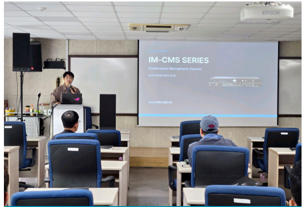
2026 신제품 소개