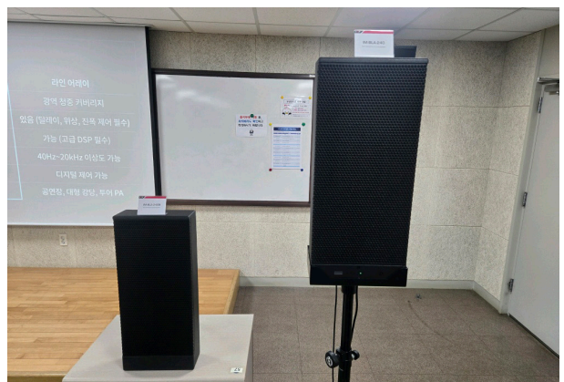
빔 스티어링 스피커 / IM-BLA-240