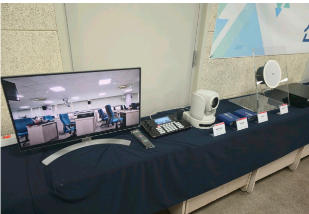
PTZ 카메라 (IM-PTZ-F30/IM-PTZ-F60)