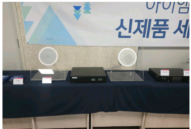
뮤직 실링 스피커 / IMP-CS-440MC