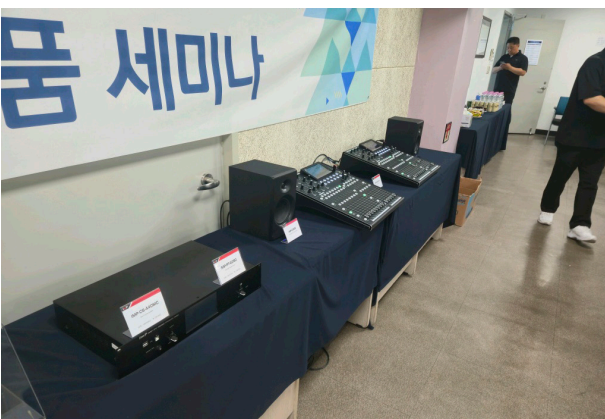
룸모니터 스피커 / IMP-CM5P