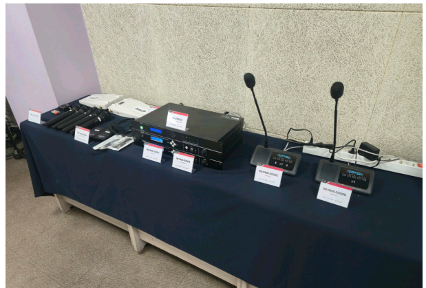
회의 솔루션 / IM-CMS-3000 Series