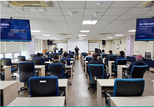
2026 신제품 소개